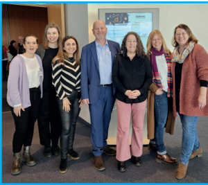
Kollegialer Austausch auf der didacta.

kommunale Verantwortungsgemeinschaften, um die Herausforderungen gemeinsam zu lösen.